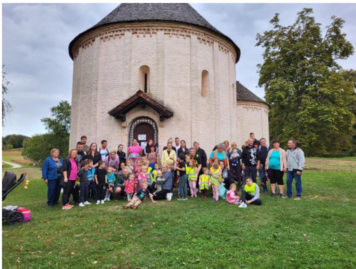
Tradicionalni pohod prijateljstva k Rotundi – s starši enot Fokovci in Prosenjakovci