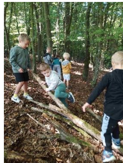
Dejavnosti v gozdu