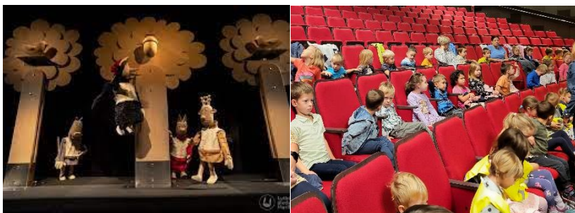
Želodkova skrivnost (Gledališče Maribor) - 1. predstava lutkovno-filmskega abonmaja 2023/24

Otroci letnika 2018 in 2019 bodo vključeni v lutkovno-filmski abonma Gledališča Park v Murski Soboti - v organizaciji Zveze za kulturo, turizem in šport Murska Sobota. Stroške prevoza in stroške programa - ceno lutkovnega abonmaja za 6 predstav bodo poravnali starši, ki pa lahko zaprosijo tudi za pomoč iz sredstev Sklada vrtca.