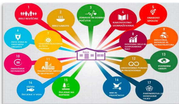
17 Unescovih razvojnih ciljev