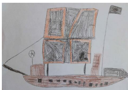
Jaša Ošljaj, 5 let, Vrtec Bogojina, »Mornarska in gusarska ladja«