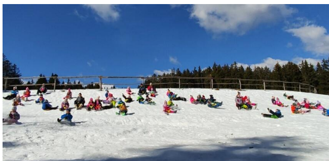
Zimovanje – Pohorje 2023

Čas izvedbe: 19. – 22. marec 2024, Pohorje.