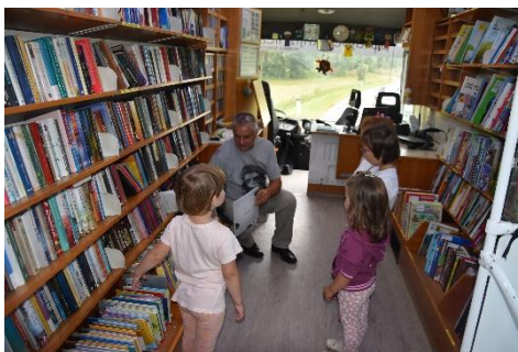
Potujoča knjižnica »Bibliobus«