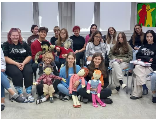
Predstavitve Programa NEON – 3. delavnica, dijakom 3. letnika PŠV na GFML

Projekt se bo izvajal za otroke letnika 2018 in 2019 in sicer v oddelkih: Bogojina, odd. 3-6 let, Filovci, odd. 1-6 let, Fokovci, odd. 2-6 let, Martjanci, odd. 4-6 let in Moravske Toplice, odd. 4-6 let.