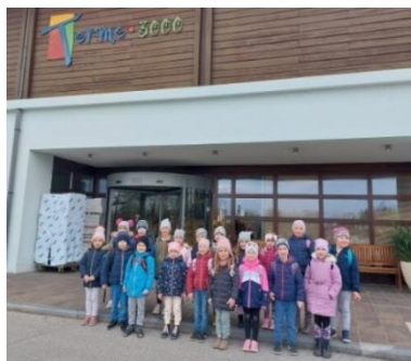
Plavalni tečaj 2023 – Terme 3000