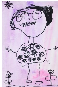
Izabela Sabotin – 5 let, Vrtec Prosenjakovci, »To sem jaz«