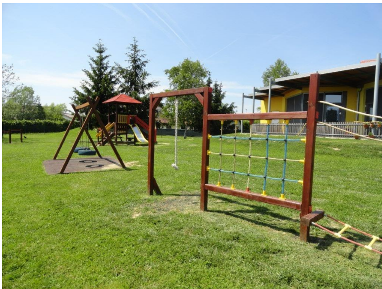
Centralna enota Moravske Toplice - igrišče

S povezavo enot v skupni javni zavod so vse enote pridobile enake možnosti za razvoj, enotno pedagoško in organizacijsko vodstvo ter enake možnosti za izobraževanje, kar je bilo v prejšnji obliki delovanja vrtcev najbolj pomanjkljivo. V zavod je združenih šest enot: Bogojina, Filovci, Fokovci, Martjanci, Moravske Toplice in dvojezična enota Prosenjakovci - Kétnyelvű egység Pártosfalva.